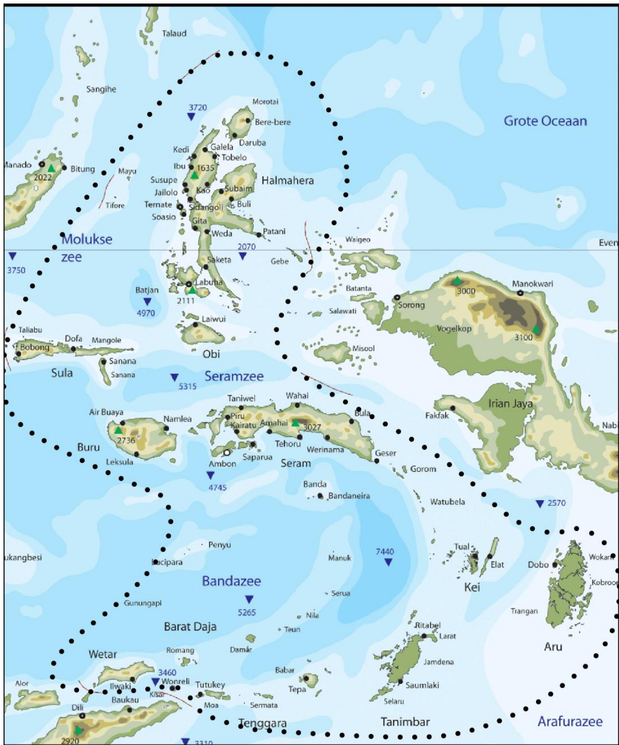
Figuur 4: Detailkaart van de Molukse eilanden