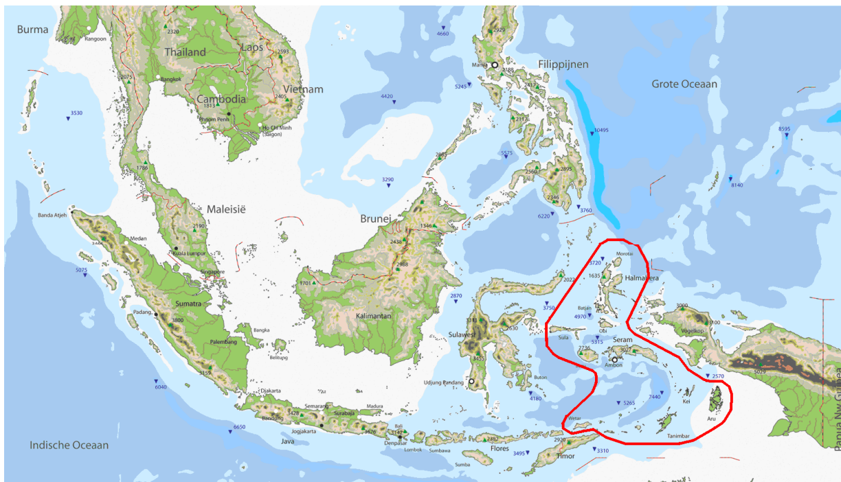
Figuur 1: De Indonesische archipel met de Molukken rood omlijnd